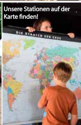
Unsere Stationen auf der Karte finden!