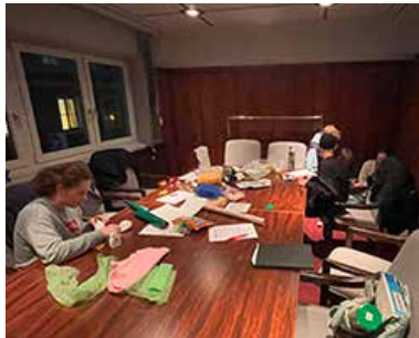
Gestaltung, Vorbereitung und Durchführung eigener Gruppenstunden zu Themen der Pfadistufe "Wagt es...!"