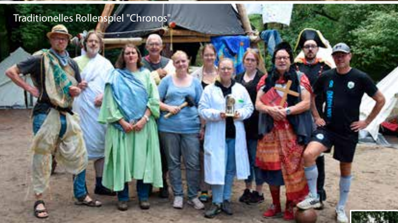
Traditionelles Rollenspiel "Chronos"