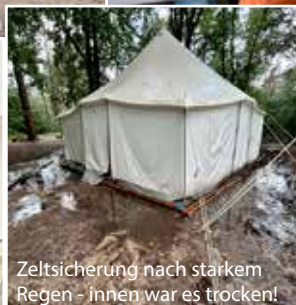
Zeltsicherung nach starkem Regen - innen war es trocken!