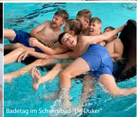
Badetag im Schwimmbad "De Duker"