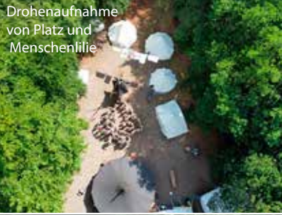
Drohenaufnahme von Platz und Menschenliebe