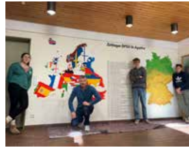
Das fast fertige Endergebnis nach einem langen Samstag und Sonntagmorgen. Sieht sehr cool aus!