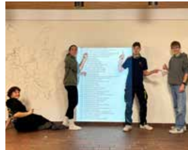
Vorbereiten der Lagerchronik-Wandkarten durch Grenzziehen der Europakarte.