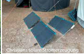
Christians solare Stromerzeugung