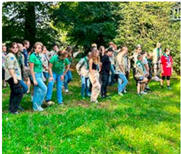
Bezirks-Pfaditag an der Schule Beck in Lembeck zum Thema "Steinzeit" und "Back to the roots" mit coolen Workshops, wie bspw. Feuermachen, Ur-Korn-Stockbrot, Pfeil & Bogen, Höhlenmalerei mit Naturfarben, Edelsteinsacknähen.