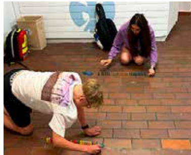
Gruppenraum-Aufräum-Challenge: Die längste zusammenhängende Dominosteinkette gewinnt, bzw. die Kürzeste verliert, Verlierer musste Saugen!!!