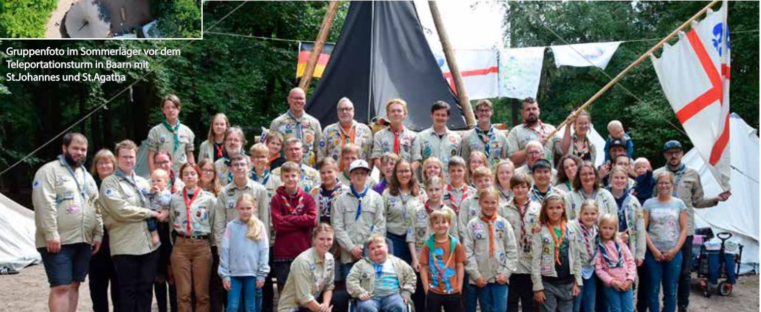
Gruppenfoto im Sommerlager vor dem Teleportationsturm in Baarn mit St.Johannes und St.Agatha