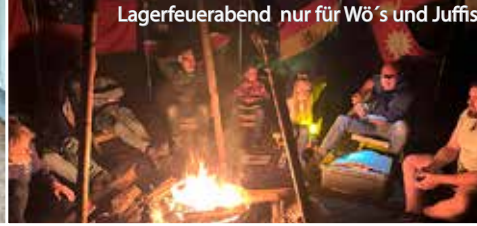
Lagerfeuerabend nur für Wö's und Juffis